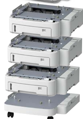
Bandeja 530 folhas Código: 45466501