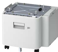
Bandeja 2.000 folhas Código: 45393301