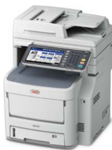
Bandeja 530 folhas Código: 45466501

Painel touch screen de 9" facilita a navegação, otimiza a produtividade e permite o acesso à soluções baseadas na Web