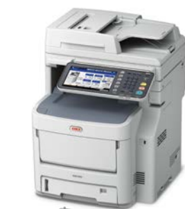
Bandeja 530 folhas Código: 45466501